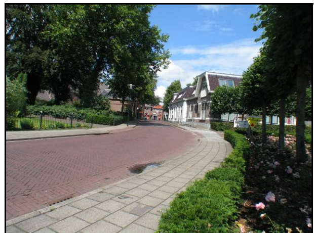
De omgeving van het centrum Den Ham.